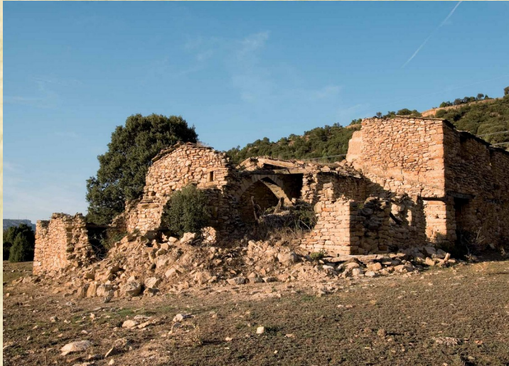
- mas en runes -

D'ací pocs anys per un motiu o un altre no quedaran habitants al poble ni masovers al camp. Tothom marxa a viure a les ciutats. Quina sort! Abans havíem de fugir a un altre país... Temps foscos i de silenci!!!