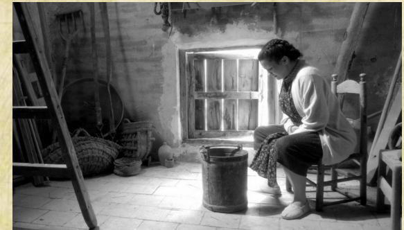
- masovera -