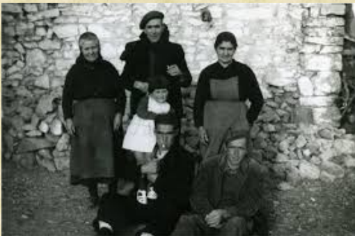
- família masovera -