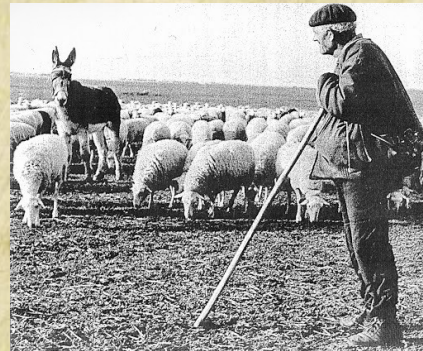
- masover pasturant -