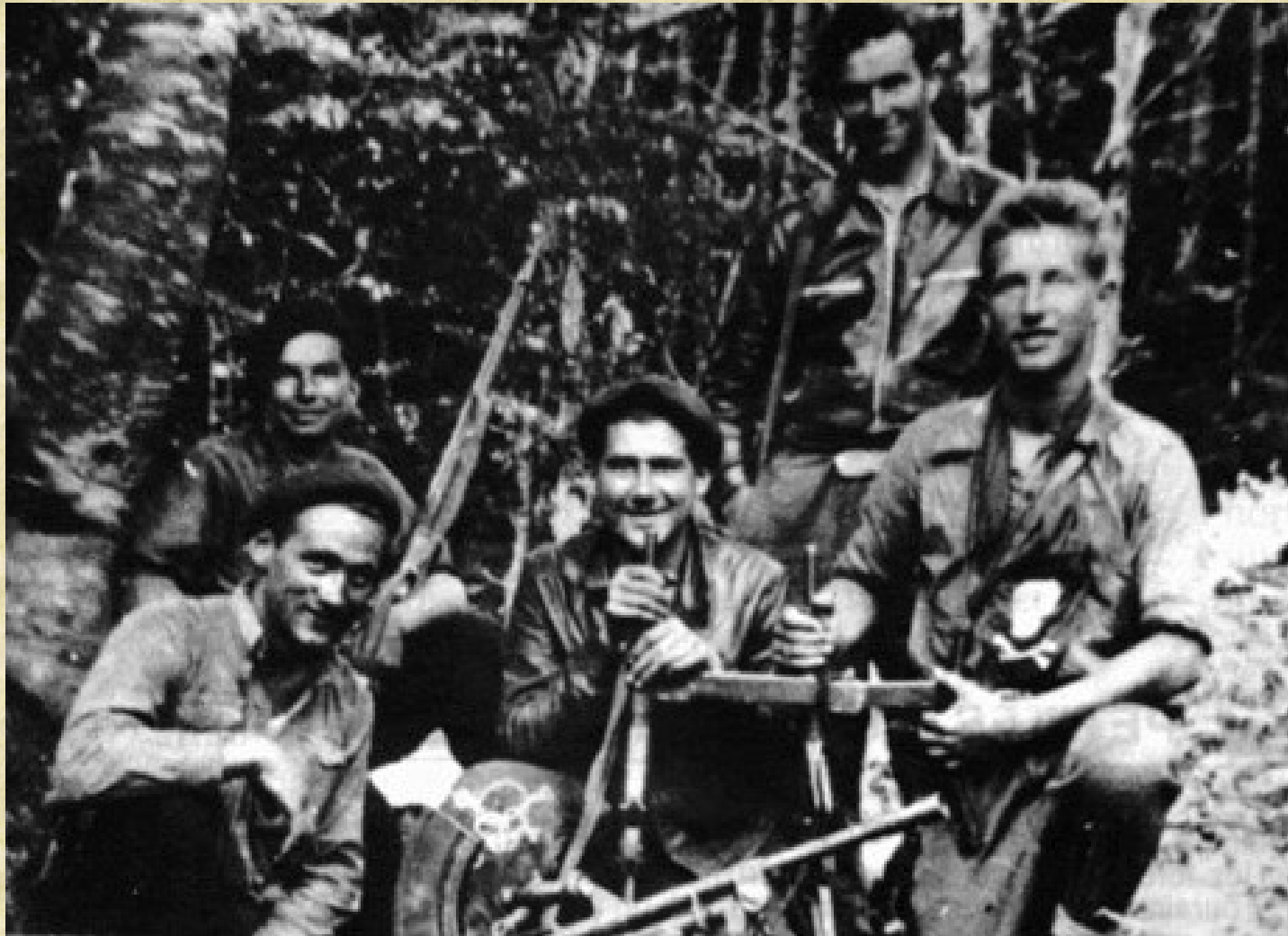
- colla de maquis al bosc -