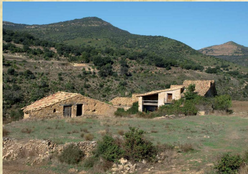
- paisatge rural d'un mas -

No descartem, però, fer l'espectacle en el seu format original itinerant quan tornem a la normalitat. Tant de bo siga aviat.