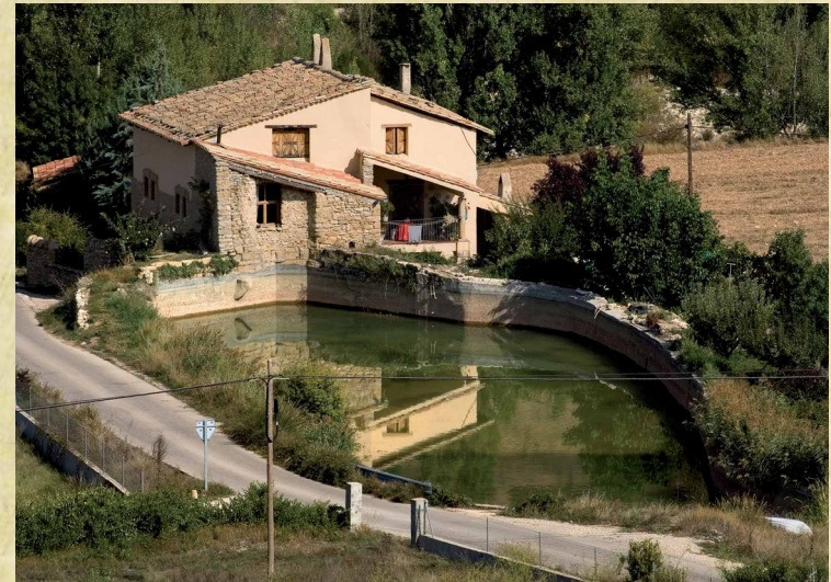
- mas restaurat -