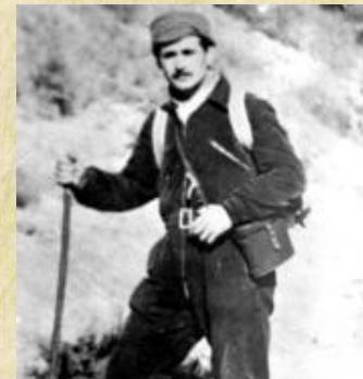
- maqui -